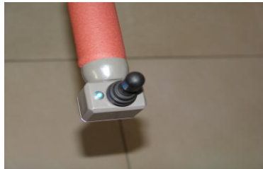
Joystick blaue LED