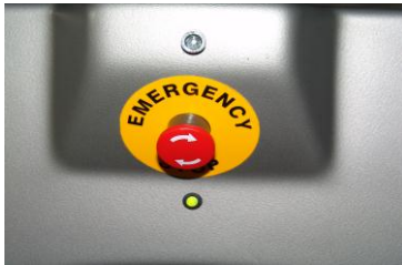
Notausschalter grüne LED